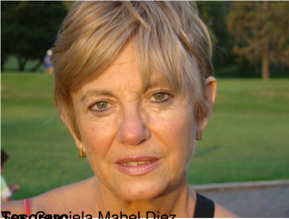
Sec. Cecilia Mabel Diez

Sábado, 16 de Abril de 2011 11:20 - Actualizado Lunes, 16 de Mayo de 2016 23:17